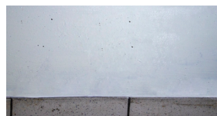
2 Jahre nach Ag + Behandlung